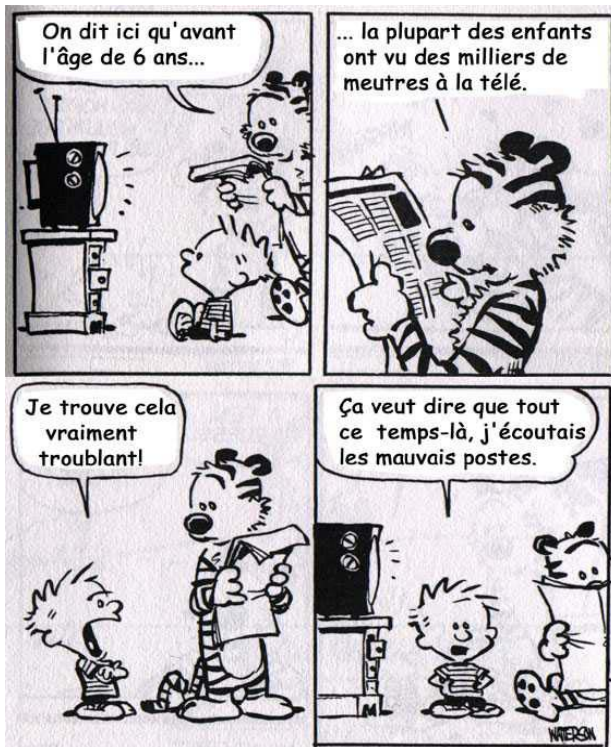
Calvin et Hobbes par B. Watterson