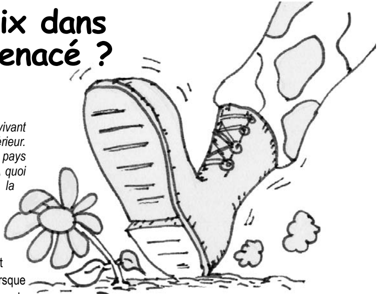
Illustration : Mighel Gagnon

65 pays dans lesquels des enfants ont été tués par des mines, près des 2/3 n'étaient pas en guerre durant cette période. (UNICEF, 2006)